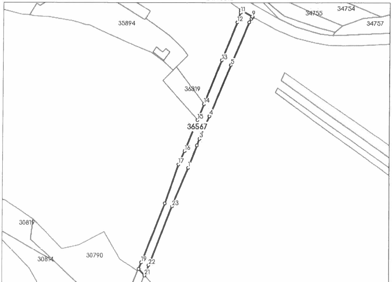
DETALII LINIARE IMOBIL

* Suprafața este determinată în planul de proiecție Stereo 70.